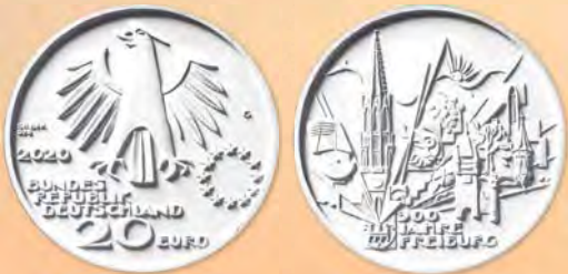
3. Preis: Victor Huster, Baden-Baden