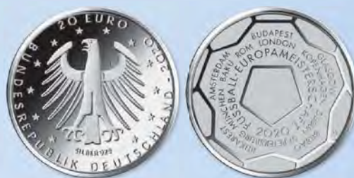
1. Preis und Ausführung: Thomas Serres, Hattingen, für die Motivseite, Erich Ott für die Wertseite

Dem Gestalter gelingt mit seinem Entwurf der Bildseite die harmonische Verbindung mit der vorgegebenen Wertseite und ihrer würdigen Adlerdarstellung. Die gewählten Gestaltungselemente – Fußball, Europa-Karte und Austragungsorte – sind zu einer überzeugenden Einheit ins Zentrum des Münzrunds zusammengeführt. So entsteht ein eigenständiges Symbol für das anstehende Turnier, das durch die Umschrift benannt wird. Die gewählte Typografie entspricht nicht exakt der Wertseite.