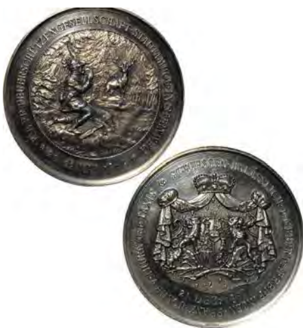
Eine Schützenmedaille von Lauer aus dem Jahr 1894 mit – wie ich es empfinde – sehr feiner, detaillierter Prägung; Durchmesser: 35 mm, Material: 990 Silber, Gewicht: 89 g.