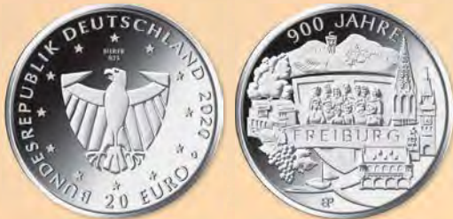
1. Preis und Ausführung: Bastian Prillwitz, Berlin

Zum 900-jährigen Jubiläum der Stadt Freiburg im Breisgau stellt der Entwurf die Bürgerschaft Freiburgs vor dem Stadtwappen Freiburgs in den Mittelpunkt. Auf der rechten Seite werden die markanten historischen Gebäude und auf der linken Seite die naturverbundenen Elemente der ökologischen Stadt gezeigt. Der Blick öffnet sich nach oben zum Schloßbergturm und thematisiert unten die Freiburger Bächle. Dem Künstler gelingt es, die Vielzahl der Elemente in einer hervorragenden Gesamtkomposition zusammen zu bringen. Die Wertseite mit dem würdigen Adler korrespondiert auf sehr überzeugende Weise mit der Bildseite.