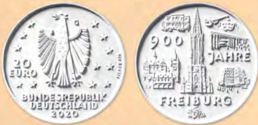
2. Preis: Reinhard Eiber, Feucht