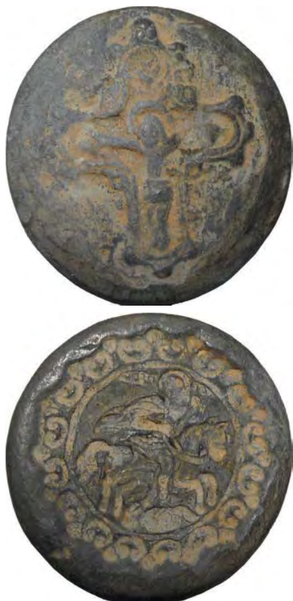
Plakette/Medaillon mit Kruzifix und inkus auf der Gegenseite eine Reiterdarstellung (ggf. St. Georg – Gestaltung erinnert an Brakteaten); Material: Blei, Durchmesser: ca. 55–57 mm Gewicht: ca. 89 g, Dicke: ca. 3–5 mm