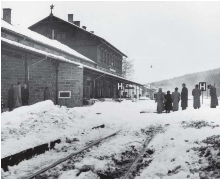
In Bayerisch Eisenstein führt die Grenze mitten durch den Bahnhof. Die Journalistin Erika Groth-Schmachtenberger hat 1952 Menschen photographiert, die hinüberschauen in die böhmische Heimat, aus der sie 1946 vertrieben wurden.

zu merken ist, von bildungsfernen Menschen mit dem fremdsprachigen bezeichnet werden. Leute, die nie sagen würden, dass sie ein Wochenende in Venetia, Brunico oder Firenze verbringen wollten, sagen Prachatice, Vimperk und Klatovy. Bei Český Krumlov lassen sie sich gerade noch herab, es Krummau zu nennen, sie schreiben es allerdings falsch mit einem „m“. Immerhin sagen sie noch Prag statt Praha. Budweis hat das Glück, dass seine tschechische Entsprechung České Budějovice für deutsche Zungen etwas schwierig ist. Auffällig ist, dass sich bei vielen Menschen, die in Bayern aufgewachsen sind, bei einem Besuch in den alten böhmischen Ort-