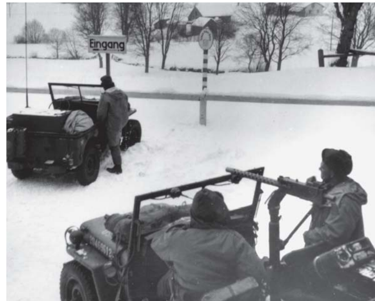
Amerikanische Soldaten patrouillierten zur Grenzsicherung, bevor der Eiserner Vorhang mit Zäunen, Stacheldraht, Minengürteln und elektrischen Fallen dem ungesetzlichen, aber gebräuchlichen Grenzübertritt für Jahrzehnte ein Ende setzte.

Wenn wir in alten Photos den alten und wieder sehr lebendigen Kulturraum Böhmerwald betrachten, mischen sich ferne Bilder, die kaum noch auf unmittelbare Erinnerungen gründen, mit jüngeren, die uns näher liegen. Die Patrouillen amerikanischer Soldaten, aber auch die Milchbänke an den Landstraßen sind uns heute schon ebenso reine Erinnerung ohne irgendwelche ding-