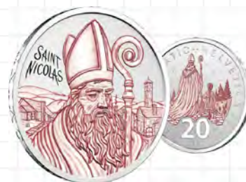
Schweiz, 20 CHF, 999er Silber, 20 g, 33 mm, Rand: DOMINUS PROVIDEBIT (Der Herr wird Vorsorge treffen) + 13 Sterne, Auflage: 7.500 in unc., 5.800 mit Farbe in PP, 200 mit Farbe in PP und signiertem Künstlerzertifikat, Münzstätte: Swissmint, Bern.

Am 27. November 2024 emittierte die Schweiz eine 20-Franken-Silbermünze auf den Heiligen Nikolaus. Dieses Fest hat vor allem in Freiburg, in der Zentralschweiz sowie in vielen Städten und Dörfern einen besonderen Zauber. Überall dort strömen die Menschen in fröhlicher Erwartung auf den Pflasterstraßen oder in den Tälern zusammen. Staunende Kinder warten ungeduldig auf den Heiligen Nikolaus, der von seinem treuen Helfer, dem Knecht Ruprecht – in der Schweiz auch Schmutzli genannt –, begleitet wird. Die Bildseite zeigt den Kopf des Heiligen Nikolaus in roter Farbe (dies aber nur auf den PP-Münzen) mit Mitra und Bischofsstab vor dörflicher Kulisse im Hintergrund und nennt die Aufschrift SAINT NICOLAS. Auf der Wertseite lesen wir CONFOEDERATIO HELVETICA / 2024 / 20 FR und sehen den Heiligen Nikolaus mit einem Kind wegschreiten, weiteren Zielen und weiteren Kindern entgegen.